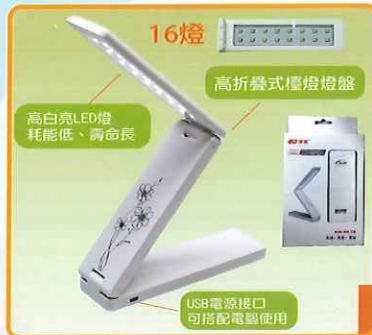
USB電源接口 可搭配電腦使用